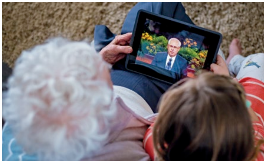
Raimond, Alberta, Kanada

Të rinj dhe të rritur, nëse bini në kurthin e Satanit, të pornografisë, mbani mend sa i mëshirshëm është Shpëtimtari ynë i dashur. A e kuptoni se sa fort ju do dhe ju ka për zemër Zoti, madje edhe tani? Shpëtimtari ynë ka fuqinë për t'ju pastruar e shëruar. Ai mund t'ju heqë dhembjen e trishtimin që ndieni dhe mund t'ju bëjë sërish të pastër nëpërmjet fuqisë së Shlyerjes së Tij.