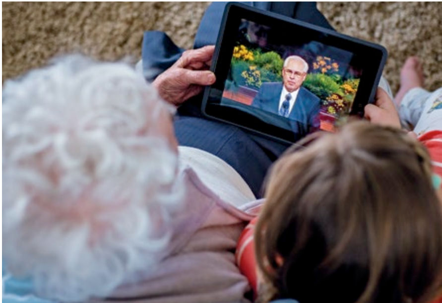
Raymond, Alberta, Kanada

fahadisoam-panantenana, fifandraisana simba, fahaverezan'ny fifehezantena ary saika tsetsefin'izany tanteraka ny fotoana sy ny saina ary ny hery.