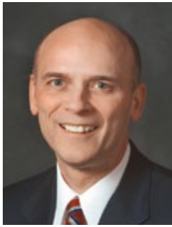
Fai 'e 'Eletā C. Scott Grow 'O e Kau Fitungofulū