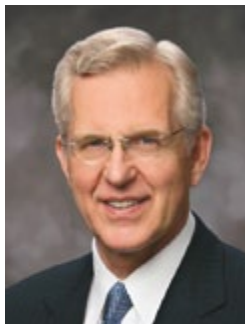
Старейшина Д. Тодд Кристоферсон Член Кворума Двенадцати Апостолов

Я знаю, что значит любить дочь Отца Небесного, которая охотно и преданно применяет весь спектр качеств, заложенных в праведной женщине. Я уверен, что в будущем, когда я снова увижу ее по ту сторону завесы, мы сможем ощутить еще большую любовь друг к другу. Мы еще сильнее будем ценить друг друга благодаря времени, которое мы провели, находясь в разлуке и разделенные завесой. Во имя Иисуса Христа, аминь. ■