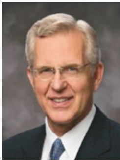
Vârstnicul D. Todd Christofferson din Cvorumul celor Doisprezece Apostoli

Știu ce înseamnă să iubești o fiică a Tatălui din Cer, care, cu grație și devotament, a trăit splendoarea feminității depline a calității ei de femeie neprihănită. Sunt convins că, în viitor, când o voi vedea din nou dincolo de văl, noi ne vom da seama că ne iubim și mai mult. Noi ne vom aprecia unul pe celălalt și mai mult după ce am petrecut această perioadă separați de văl. În numele lui Isus Hristos, amin. ■