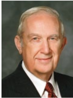
Fai 'e 'Eletā Richard G. Scott

'O e Kōlomu 'o e Kau 'Aposetolo 'e Toko Hongofulu Mā Uá