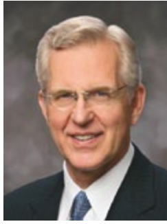
Fai 'e 'Eletā D. Todd Christofferson

'Oku ou 'ilo'i e 'ofa ki ha 'ofefine 'o e Tamai Hēvaní ne anga'ofa mo mo'ui mateaki 'i he tu'unga anga- tonu 'o e fefiné. 'Oku ou 'ilo'i pau 'i he'ema toe fesiofaki he kaha'ú 'i he tafa'aki 'e taha 'o e veilí, te ma 'ilo'i ai 'oku toe lahi ange 'ema fe'ofa'akí. 'E toe lahi ange 'ema hounga'ia, hili hono fakamavahevahe'i kimaua he taimi ni 'e he veilí. 'I he huafa 'o Sisū Kalaisí, 'ēmeni. ■