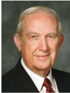
Na Elder Richard G. Scott

No te Pūpū no te Tino Ahuru Ma Piti Aposetolo