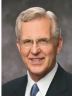
Երեց Դ. Թոդ Քրիստոֆերսոն Տասներկու Առաքյալների Քվորումից

Ես գիտեմ, թե ինչ է նշանակում սիրել Երկնային Հոր դստերը, ով բարեհաճությամբ ու նվիրվածությամբ ապրեց՝ առաքինի կնոջ լիարժեք ու շքեղ իր կյանքը: Ես վստահ եմ, որ երբ ապագայում ես կրկին տեսնեմ նրան վարագույրի մյուս կողմում, մենք կզգանք, որ մենք հիմա ավելի շատ ենք սիրահարված: Մենք հիմա իրար ավելի շատ կզնահաստենք՝ այս ժամանակը վարագույրով բաժանված անցկացնելու պատճառով, Հիսուս Քրիստոսի անունով, ամեն: ■