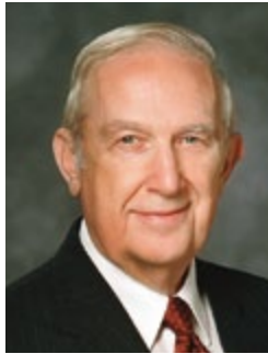
Երեց Ռիչարդ Գ. Սոթթ Տասներկու Առաքյալների Քվորումից