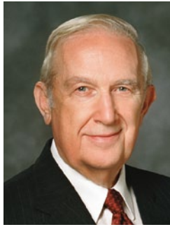
Nataon'ny Loholona Richard G. Scott Ao amin'ny Kôlejin'ny Apôstôly Roambinifololahy