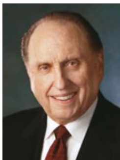
Ni Pangulong Thomas S. Monson

Ipinahahayag ko ang aking patotoo bilang apostol na ang Ama at ang Anak ay buhay. Ang diwa ng paghahayag ay totoo—at maaaring magamit at ginagamit sa ating buhay at sa Ang Simbahan ni Jesucristo ng mga Banal sa mga Huling Araw. Pinatotohanan ko ang mga katotohanang ito sa sagradong pangalan ng Panginoong Jesucristo, amen. ■