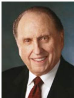
Na te peresideni Thomas S. Monson

Te faaite nei au i to'u iteraa aposetolo e, te ora nei te Metua e te Tamaiti. E parau mau te varua o te heheuraa—e e nehenehe e e ohipa oia i roto i to tatou oraraa tata'itahi e i roto i te Ekalesia a Iesu Mesia i te Feia Mo'a i te Mau Mahana Hopea Nei. Te faaite papû nei au i teie mau parau mau na roto i te i'oa o te Fatu o Iesu Mesia ra, amene. ■