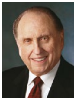
President Thomas S. Monson

Jag förkunnar mitt apostoliska vittnesbörd om att Fadern och Sonen lever. Uppenbarelsens ande är verklig. Den kan verka och ska verka i vårt eget liv och i Jesu Kristi Kyrka av Sista Dagars Heliga. Jag vittnar om dessa sanningar i Herren Jesu Kristi heliga namn, amen. ■