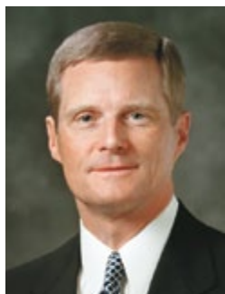
Äldste David A. Bednar i de tolv apostlarnas kворum