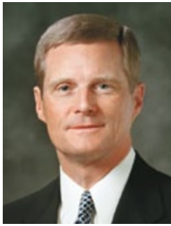
Saunia e Elder David A. Bednar