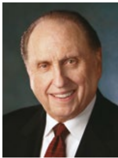
Saunia e Peresitene Thomas S. Monson

Ou te tuuina atu la'u molimau faaposetolo o loo soifua le Tama ma Lona Alo. E moni le agaga o faaaliga—ma e mafai ma e galue i o tatou ola taitoatasi faapea foi i Le Ekalesia a Iesu Keriso o le Au Paia o Aso e Gata Ai. Ou te molimau atu i nei upumoni i le suafa paia o le Alii o Iesu Keriso, amene. ■