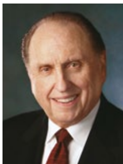
Președintele Thomas S. Monson

Vă declar mărturia mea de apostol că Tatăl și Fiul trăiesc. Spiritul revelației este real – și poate funcționa și funcționează în viețile fiecăruia dintre noi și în Biserica lui Isus Hristos a Sfinților din Zilele din Urmă. Mărturisesc despre aceste adevăruri, în numele sacru al lui Isus Hristos, amin. ■