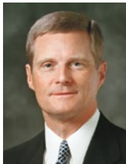
Vârșnicul David A. Bednar din Cvorumul celor Doisprezece Apostoli