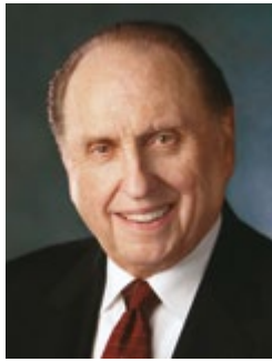
President Thomas S. Monson

Ik geef u mijn apostolische getuigenis dat de Vader en de Zoon leven. De geest van openbaring bestaat echt — en kan werkzaam zijn en is ook werkzaam in ons eigen leven en in De Kerk van Jezus Christus van de Heiligen der Laatste Dagen. Van die waarheden getuig ik in de heilige naam van de Heer Jezus Christus. Amen. ■