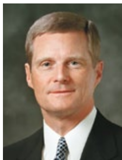
Ouderling David A. Bednar van het Quorum der Twaalf Apostelen