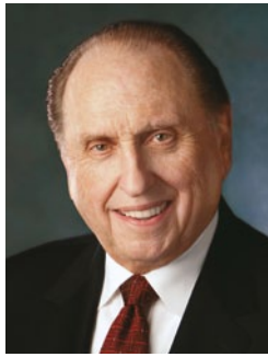
Nataon'ny Filoha Thomas S. Monson

Mijoro ho vavolombelona amin'ny maha-apôstôly ahy aho fa ny Ray sy ny Zanaka dia velona. Tena misy ny fanahin'ny fanambarana—ary afaka miasa sy tena miasa eo amin'ny fiainantsika manokana sy ao amin'ny Fiangonan'i Jesoa Kristy ho an'ny Olomasin'ny Andro Farany. Mijoro ho vavolombelona ny amin'ireo fahamarihana ireo aho amin'ny anarana masin'i Jesoa Kristy, amena. ■