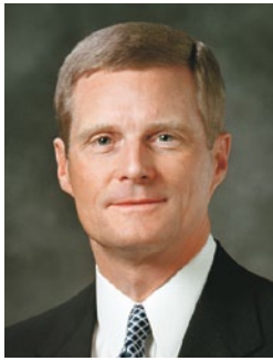
Nataon'ny Loholona David A. Bednar Ao amin'ny Kôlejin'ny Apôstôly Roambinifololahy