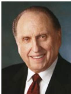
Írta: Thomas S. Monson elnök

Apostoli tanúbizonyosságot teszek arról, hogy az Atya és a Fiú élnek. A kinyilatkoztatás lelke valóságos – működhet és működik egyéni életünkben, valamint Az Utolsó Napok Szentjeinek Jézus Krisztus Egyházában. Ezekről az igazságokról teszek bizonyosságot az Úr Jézus Krisztus nevében, ámen. ■