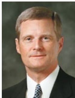
Írta: David A. Bednar elder a Tizenkét Apostol Kvórumából