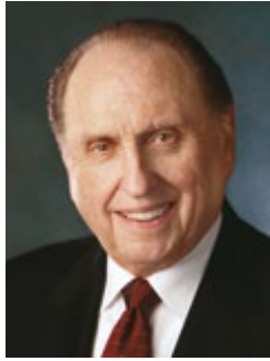
Mai vei Peresitedi Thomas S. Monson

Au cavuta kina na noqu ivakadinadina vakaiapositolo ni rau bula tiko na Tamada kei na Luvena. E ka dina na yalo ni ivakatakila—ka na rawa ni cakacaka ena noda dui bula yadua kei na Lotu i Jisu Karisito ni Yalododonu Edaidai. Au vakadinadinataka na dina oqo ena yaca tabu ni Turaga o Jisu Karisito, emeni. ■