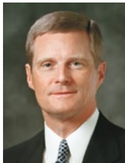
Ældste David A. Bednar De Tolv Apostles Kvorum