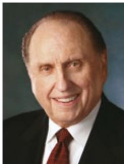
Præsident Thomas S. Monson

Jeg tilkendegiver som apostel mit vidnesbyrd om, at Faderen og Sønnen lever. Åbenbarelsens ånd er virkelig – og kan virke og virker i vores personlige tilværelse og i Jesu Kristi Kirke af Sidste Dages Hellige. Jeg vidner om disse sandheder i Herren Jesu Kristi hellige navn. Amen. ■