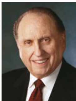
Ni Presidente Thomas S. Monson

Ako nagpahayag sa akong pagka-apostol nga pagsaksi nga ang Amahan ug ang Anak buhi. Ang espiritu sa pagpadayag tinuod—ug makahimo ug molihok diha sa atong tagsa-tagsa ka mga kinabuhi ug diha sa Ang Simbahan ni Jesukristo sa mga Santos sa Ulahing mga Adlaw. Ako nagpamatuod niini nga mga kamatuoran diha sa sagrado nga pangalan sa Ginoo nga si Jesukristo, amen. ■