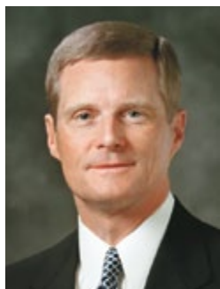
Ni Elder David A. Bednar

Sa Korum sa Napulog Duha ka mga Apostoles