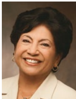
Írta: Silvia H. Allred

első tanácsos a Segítőegylet általános elnökségében