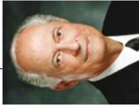
Robert D. Hales