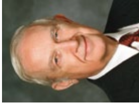
Richard G. Scott