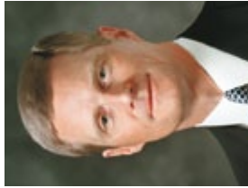
David A. Bednar