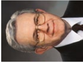
Boyd K. Packer