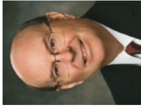
Quentin L. Cook