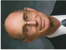
Henry B. Eyring Tauturu Matamua