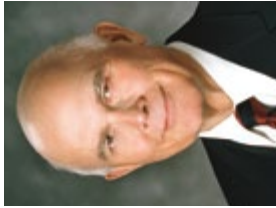
Dallin H. Oaks