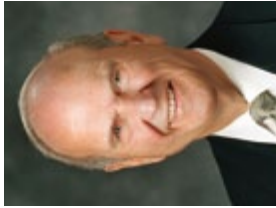
Russell M. Nelson