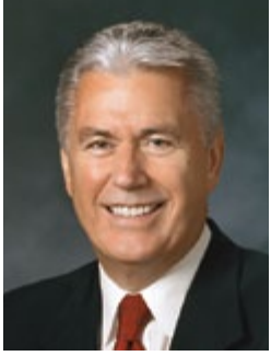
Na te Peresideni Dieter F. Uchtdorf

Tauturu Piti i roto i te Peresideniraa Matamua