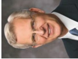
D. Todd Christofferson