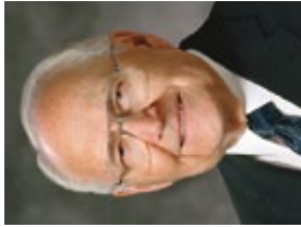
L. Tom Perry