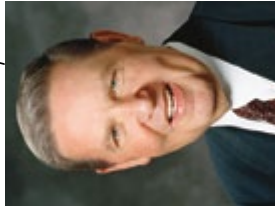
Jeffrey R. Holland