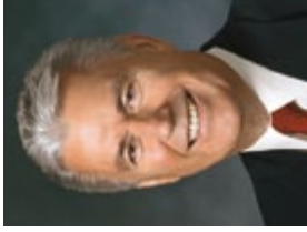
Dieter F. Uchtdorf Tauturu Piti