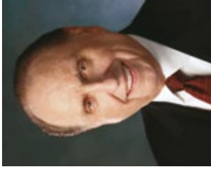
Thomas S. Monson Peresideni