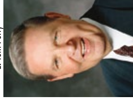
Jeffrey R. Holland