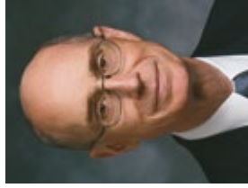
Henry B. Eyring Eerste raadgever