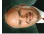
Ronald A. Rasband