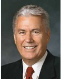
President Dieter F. Uchtdorf Tweede raadgever in het Eerste Presidium