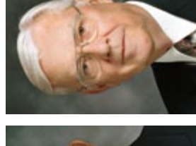
M. Russell Ballard