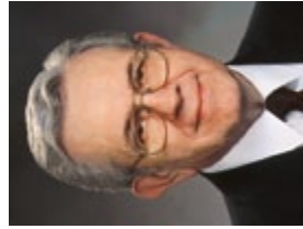
Boyd K. Packer