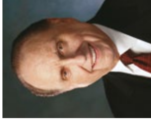
Thomas S. Monson President