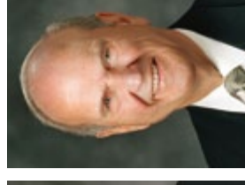
Russell M. Nelson