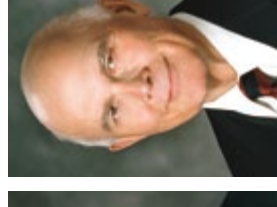
Dallin H. Oaks