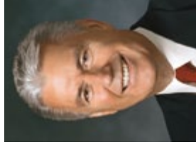
Dieter F. Uchtdorf Tweede raadgever