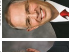
Neil L. Andersen