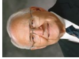
L. Tom Perry