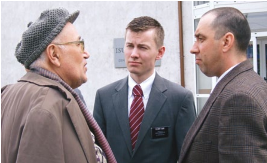
羅馬尼亞，布加勒斯特

人很難想起自己究竟從何時開始確實知道福音是真實的。主給我們「律上加律，令上加令，這裡一點，那裡一點。」 10