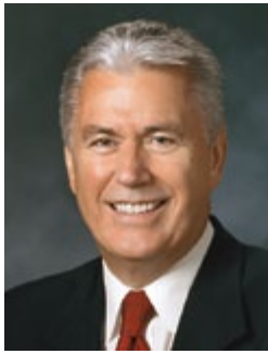
Fai 'e Palesiteni Dieter F. Uchtdorf Tokoni Ua 'i he Kau Palesiteni 'Uluaki