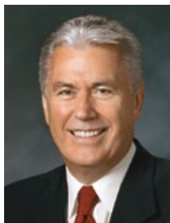
President Dieter F. Uchtdorf andre rådgivare i första presidentskapet