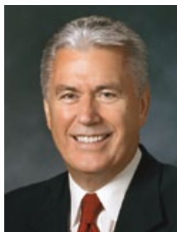
Președintele Dieter F. Uchtdorf al doilea consilier în Prima Președinție