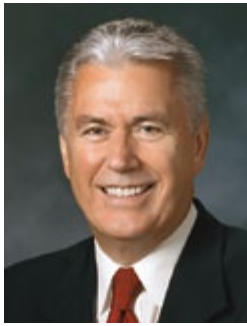
Mai vei Peresitedi Dieter F. Uchtdorf iKarua ni Daunivakasala ena Mataveiliutaki Taumada