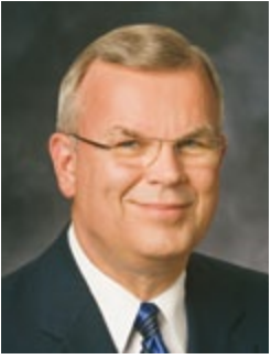
Երեց Սթիվեն Ի. Մառու Յոթանասունի Նախագահությունից