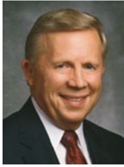
Լարրի Մ. Գիֆորդ

Իմ աղոթքն է, որ մեր հույսը մեզ առաջնորդի դեպի մեր արդար երազանքների իրականացումը: Ես հատկապես աղոթում եմ, որ Քավոյթյան հանդեպ մեր հույսը գորացնի մեր հավատքն ու գթասրտությունը, և ապագայի հավերժական հեռանկար մեզ պարզվի: Թող որ մենք բոլորս ունենանք հույսի այս կատարյալ պայծառությունը, ես աղոթում եմ Հիսուս Քրիստոսի անունով, ամեն: ■