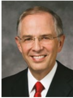
Ouderling Neil L. Andersen van het Quorum der Twaalf Apostelen

Nu het paasseizoen dichterbij komt, hoop ik dat we onze liefde en waardering voor het zoenoffer van de Heiland zullen tonen door eenvoudige, liefdevolle daden voor onze broeders en zusters, thuis, in de kerk en in de samenleving. Dat bid ik nederig in de naam van Jezus Christus. Amen. ■