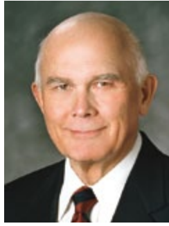
Fai 'e Elder Dallin H. Oaks

'Oku ou 'ilo 'oku mo'ui 'a e 'Otua ko 'etau Tamai Hēvanī pea 'okū Ne 'ofa 'iate kitautolu. 'Oku ou 'ilo ko hotau Fakamo'ui mo hotau Huhu'ī 'a Hono 'Alo makehe ko Sisū Kalaisī, pea ko Ia 'a e 'ulu 'o e Siasi 'oku fakatauhingoa ki Hono huafā. 'Oku ou 'ilo na'e hoko kia Siosefa Sāmita 'a e me'a kotoa pē na'ā ne fakamatala ki ai mo akonaki 'aki fekau'aki mo hono toe fakafoki mai 'o e Ongoongolele'i hotau kuongā ni. 'Oku ou 'ilo 'oku tataki kitautolu 'e he kau 'aposetolo mo e kau palōfita he 'ahō ni pea 'oku ma'u 'e Palesitēni Tōmasi S. Monisoni 'a e ngaahi kī kotoa 'o e lakanga fakataula'eikī 'a ia 'oku fie ma'u ke faitāpuekina 'aki 'etau mo'ui mo 'unuaki ki mu'a e ngāue 'a e 'Eikī. 'Oku ou 'ilo 'oku 'i ai 'etau totonu kotoa ki he 'ilo ko 'enī pea kapau 'okū ke fefa'uhi mo ia, te ke lava 'o falala ki he mo'oni 'o e ngaahi fakamo'oni 'okū ke fanongo ki ai mei he tu'unga malangā ni 'i he konifelenisi ko 'enī. Ko 'eku 'ilō mo 'eku fakamo'oni ia ki he ngaahi me'ā ni, 'i he huafa 'o Sisū Kalaisī, 'ēmeni. ■