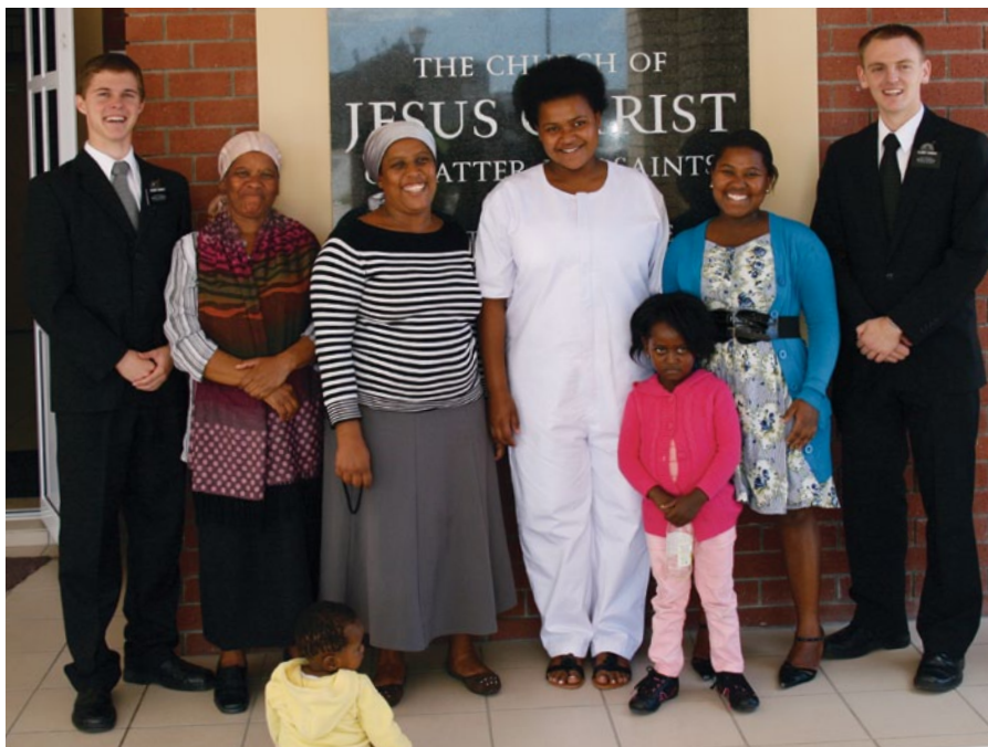
Khayelitsha, Afrika Atsimo

miaramila am-paneva mena avy tamin'ny toerana maro samihafa azy ireo dia nalefa tany Korea izy ireo, izay niainan'izy ireo karazan'ady faran'izay mafy indrindra tamin'izany ady izany. Nandritra ny fifandonana iray dia tsy maintsy nanohitra fanafihana mivantana nataon'ireo andian-tafiky ny fahavalo an-jatony maro izy ireo, fanafihana izay namotika sy nandrava ireo andian-tafika an-tanety hafa.