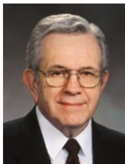
Av president Boyd K. Packer President for De tolv apostlers quorum