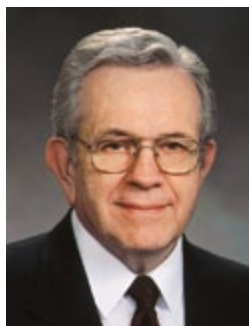
President Boyd K. Packer President van het Quorum der Twaalf Apostelen