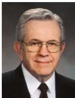
Par Boyd K. Packer Président du Collège des douze apôtres