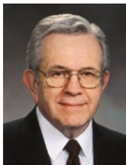
Ni Presidente Boyd K. Packer

Presidente sa Korum sa Napulog Duha ka mga Apostoles