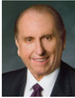
Ni Presidente Thomas S. Monson