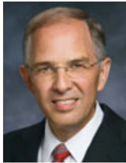
Na Elder Neil L. Andersen

E oti teie mau mea i te faaoti-manuia-hia mai te mea te heheuraa e faaohie i roto i te haapiiraa, o te faatupu mai i te hiaai o te mau taata o te haamaramaramahia e te Varua o te Atua. I muri iho, mai te mea e, e faaohipa ratou i te faaroo, e nehenehe te Varua e faaite ia ratou te mau mea o te parau-ti'a ra. No teie mau mea, te faaite papu nei i te reira na roto i te i'oa o Iesu Mesia, amene. ■