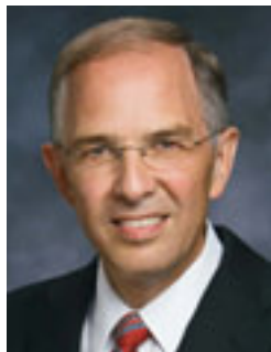
Vârșnicul Neil L. Andersen, din Cvorumul celor Doisprezece Apostoli

Acest lucru poate fi realizat mai eficient dacă revelația este facilitată în timpul procesului de predare, creându-se, astfel, în oameni dorința de a fi iluminați de Spiritul lui Dumnezeu. Apoi, pe măsură ce își exercită credința, Spiritul poate să le facă cunoscute lucrurile legate de dreptate . Despre aceste lucruri vă mărturisesc în numele lui Isus Hristos, amin. ■