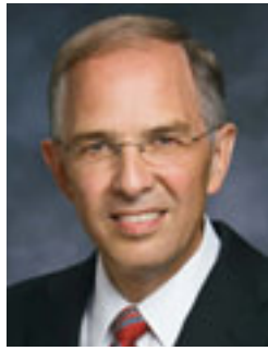
Երեց Նիլ Լ. Անդերսոն

Դրան ավելի արդյունավետ կարելի է հասնել, եթե հայտնություն է խթանվում ուսուցման ընթացքում, այդպիսով ստեղծելով մարդկանց մոտ Աստծո Հոգով ուսուցանվելու ցանկություն: Ապա, երբ նրանք գործածեն հավատք, Հոգին կարող է նրանց հայտնի դարձնել արդարությանը վերաբերող բաները: Այս բաների մասին ես վկայում եմ Հիսուս Քրիստոսի անունով, ամեն: ■