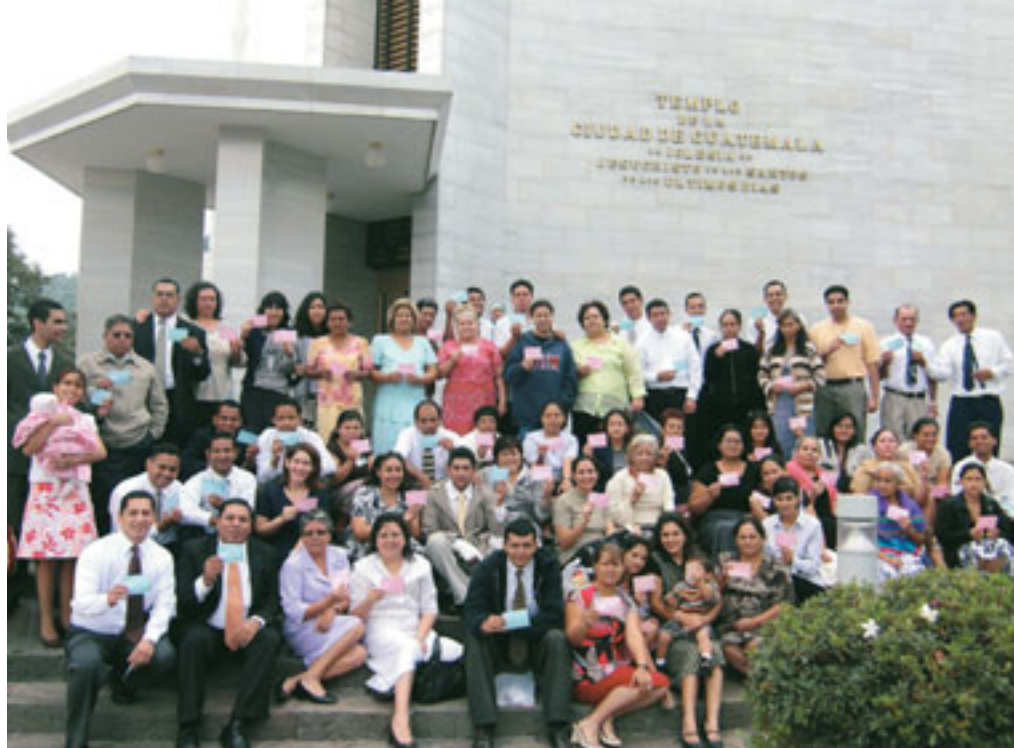
Святі з колу Ілопанго в Сан-Сальвадорі, Сальвадор, відвідують храм у місті Гватемала, Гватемала.

А як же ті з вас, хто не має комп’ютера чи не хоче користуватися цією технологією? Не хвилюйтеся! Робіть крок за кроком. Почніть у себе вдома. Знайдіть картонну коробку, як радив президент Бойд К. Пекер 11 . Покладіть туди важливі записи про себе і про вашу сім’ю. Додавайте інформацію, отриману від ваших членів родини. Потім скористайтеся допомогою консультанта з сімейної історії у вашому приході чи філії. Програма нова FamilySearch дасть можливість консультанту виконати для вас необхідні дії, у тому