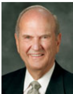
Старійшина Рассел М. Нельсон