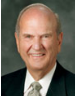
Fai 'e 'Eletā Russell M. Nelson

'O e Kōlomu 'o e Kau 'Apostolo 'e Toko Hongofulu Mā Uá