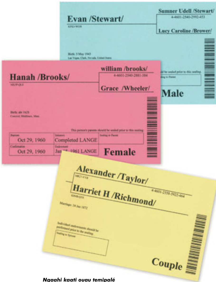
Ngaahi kaati ouau temipalé

‘o tatau ai pē pe ko e hā ‘a e matakali, fonua pe ko e tu‘unga tangata pe fe-finé. 1 Kuó Ne fai pehē mei he kamata-angá pea ‘e hokohoko atu ‘Ene fai peheé. ‘Okú Ne fakaafei ‘a e tokotaha kotoa ke ma‘u ‘a e hakeaki‘i ta‘engatá ma‘a honau fāmilí. Ko ‘Ene ngāué ‘eni mo Hono nāunaú ke fakahoko ‘a e mo-‘ui ta‘e-fa‘a-mate mo e mo‘ui ta‘engatá—‘a e hakeaki‘i—‘o ‘Ene fānaú. 2 “He na‘e ‘ofa pehē ‘a e ‘Otuá ki māmani, na‘á ne foaki hono ‘Alo pē taha na‘e fakatupú, koe‘uhí ko ia kotoa pē ‘e tui kiate iá ke ‘oua na‘a ‘auha, kae ma‘u ‘a e mo‘ui ta‘engatá.” 3