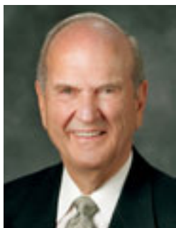
Ni Elder Russell M. Nelson Ng Korum ng Labindalawang Apostol