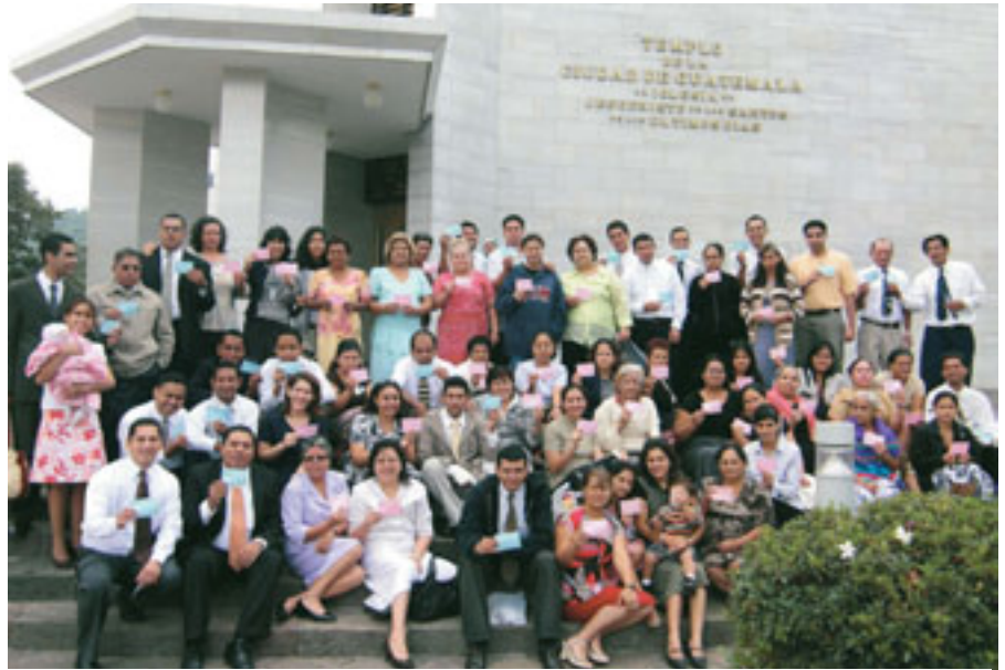
Dumalo ang mga banal mula sa San Salvador El Salvador Ilopango Stake sa Guatemala City Guatemala Temple.

magamit na kompyuter o mas piniling huwag gamitin ang teknolohiyang ito? Huwag mag-alala! Hinay-hinay lang. Simulan sa bahay. Magsimula sa walang lamang kahon, tulad ng iminungkahi ni Pangulong Boyd K. Packer. 11 Ilagay sa kahong iyon ang mahahalagang impormasyon tungkol sa inyo at sa inyong pamilya. Idagdag ang mga impormasyong natipon mula sa ibang kapamilya. Pagkatapos ay humingi ng tulong sa family history consultant ng inyong ward o branch. Sa bagong FamilySearch system magagawa ng consultant ang lahat ng gagawin sa kompyuter para sa iyo, kasama na ang paghahanda ng mga pangalan para sa templo. Mga 60,000 consultant ang naglilingkod sa iba't ibang panig ng mundo. Ang isang consultant na nasa inyong ward o branch ay lubos na makatutulong sa iyo.