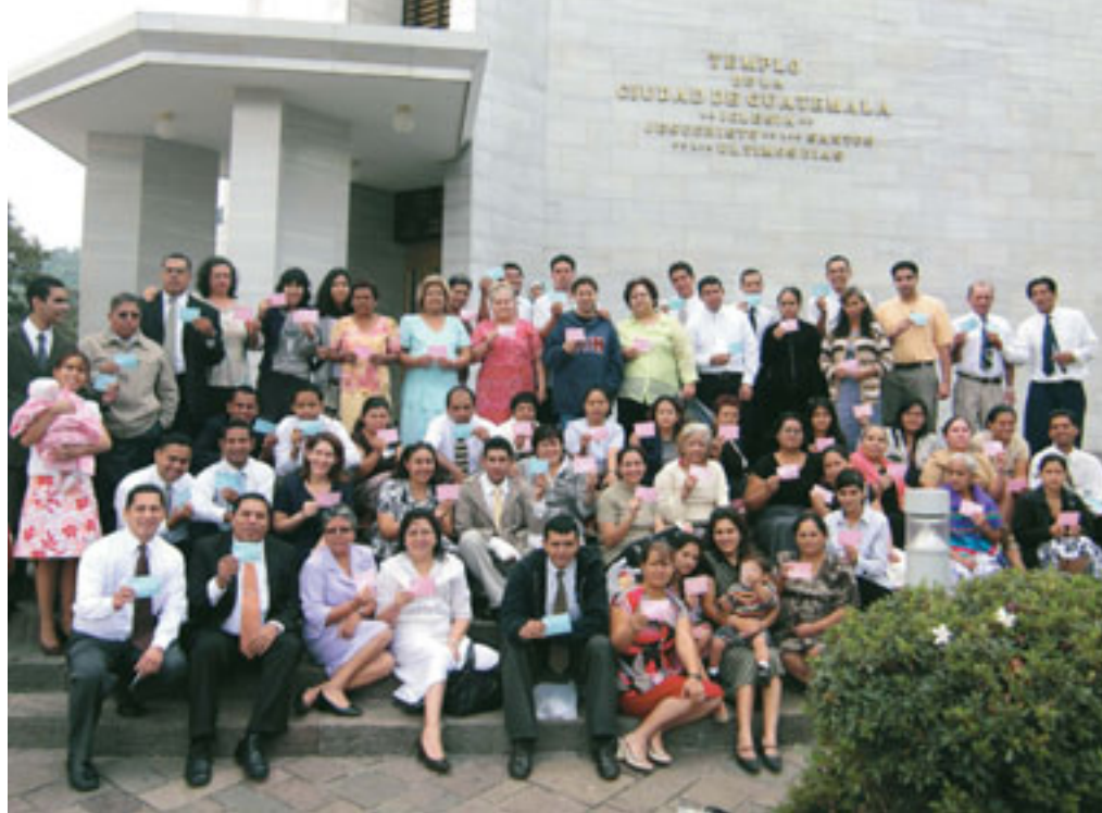
Te feia mo'a no te titi no San Salvador El Salvador Ilopango teie i te Hiero no Guatemala City, i Guatemala.

Ua tau i te faanahoraa FamilySearch apî i te tereraa o te ohipa aamu utuafare na roto i te faaohieraa i te hamani i te hoê apaparaa tupuna otahi. I mutaa iho ra, e haapa'o noa te taata i ta'na iho raverā, ma te tape'a na'na iho i te mau parau o to'na iho fetii. E mea pinepine te hoê taata i te rave ma te ite ore i te ohipa e ravehia ra e te tahi atu mau melo o te fetii. I teie nei, e nehenehe te taata tata'itahi e horo'a i te haamaramaramaraa na roto i te faaauraa i piha'i iho ia vetahi ê no te faarahi i to ratou tumu raau fetii.