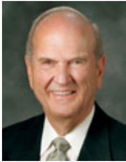
Na Elder Russell M. Nelson

No te Pūpū no te Tino Ahuru Ma Piti Aposetolo