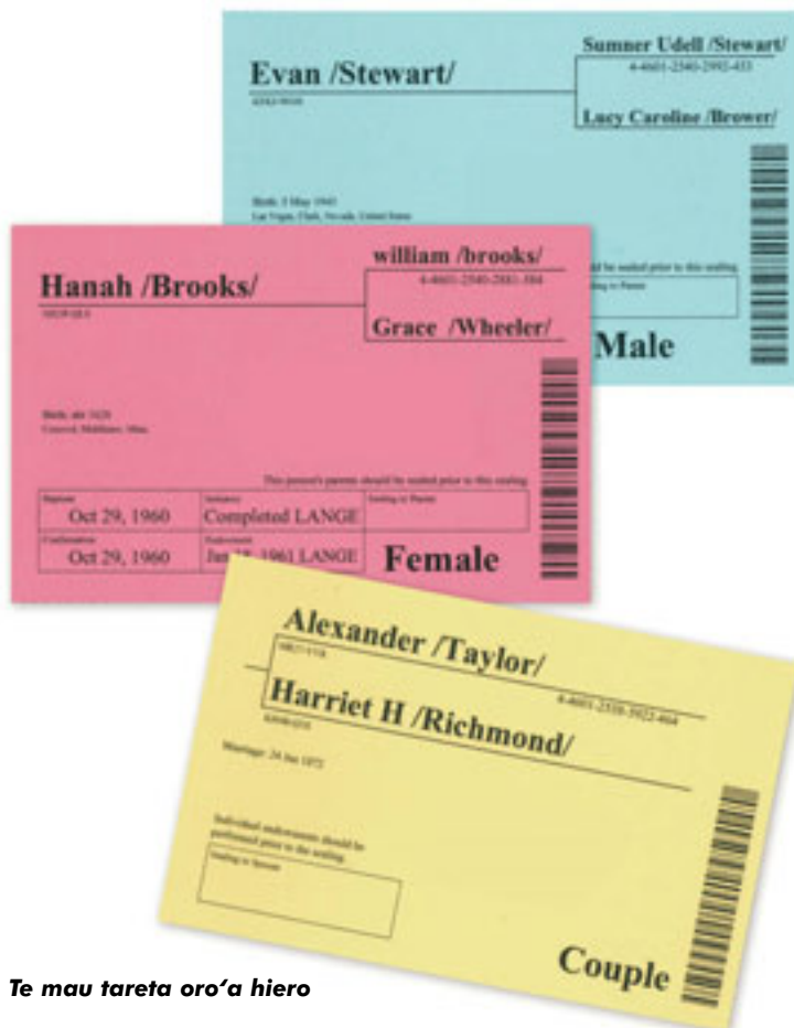
Te mau taretā oro‘a hiero

ā Oia. Te titau mai nei Oia i te mau taata atoa ia farii i te faateiteiraa mure ore no to ratou utuafare. Tā‘na ohipa e To‘na ho‘i hanahana o te faatupu iā i te tahuti ore e te ora mure ore – te faateiteiraa – o Tā‘na mau tamarii. 2 « I aroha mai te Atua i to te ao, e ua tae roa i te horo‘a mai i Tā‘na Tamaiti Fanau Tāhi, ia ore ia pohe te faaroo Ia‘na ra, ia roaraa te ora mure ore ». 3