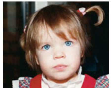
Te metua vahine o « Ruby Here », te mootua tamahine a Elder Nelson