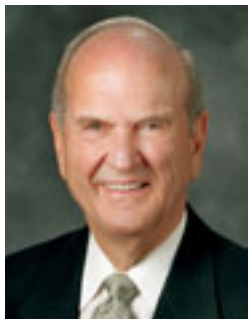
Äldste Russell M. Nelson i de tolv apostlarnas kvorum