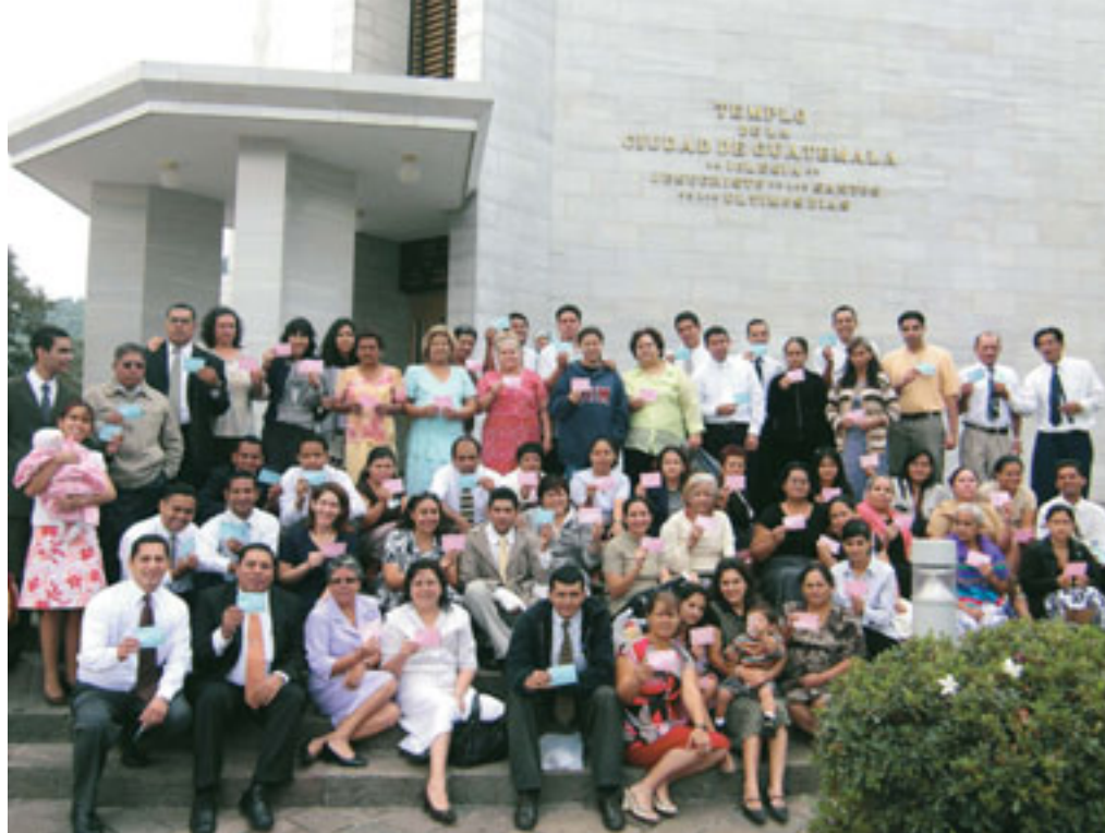
Medlemmar från Ilopango stav i San Salvador, El Salvador vid templet i Guatemala City, Guatemala.

Nya FamilySearch förändrar dynamiken i släktforskningsarbetet genom att det arbetar mot att skapa