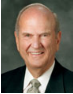
Saunia e Elder Russell M. Nelson O Le Korama a Aposetolo e Toasefululua