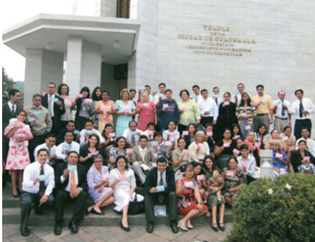
Au Paia mai le Siteki a San Salvador, El Salvador Ilopango o loo i ai i le Malumalu o Guatemala City Guatemala.

Ae faapefea la outou na e le mafai ona faaoga se komepiuta pe le manafoi e faaoga leni tekonolosi? Aua le popole! Fai se laa se tasi i le taimi.