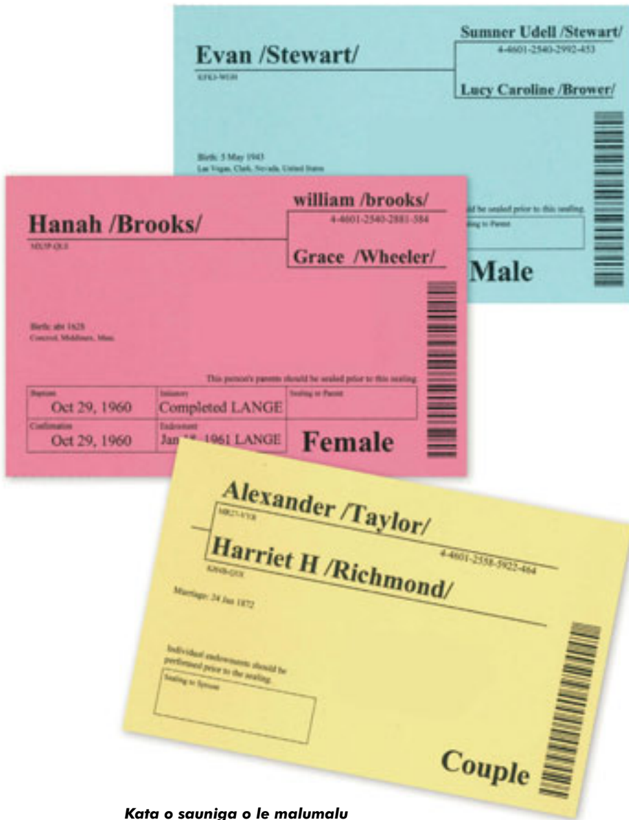
Kata o sauniga o le malumalu

lea o le faaofuina o le tagata i le tino ola pea ma le ola faavavau—o le faaeaga—o Lana fanau. 2 “Aua ua faapea lava ona alofa mai o le Atua i le lalolagi, ua ia aumai ai lona Atalii e toatasi, ina ia le fano se tasi e faatuatua ia te ia, a ia maua le ola e faavavau.” 3