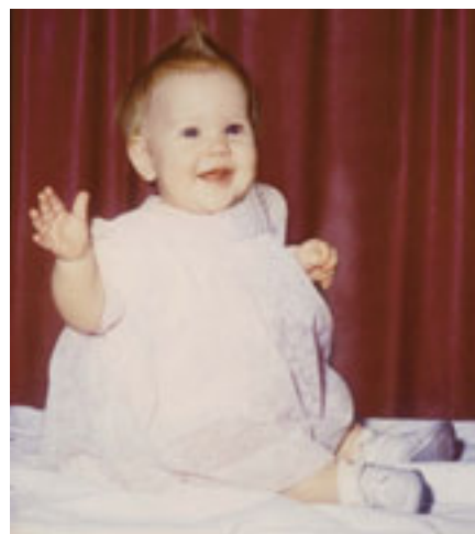
Bunica „scumpei Ruby”, fiica vârstnicului Nelson.