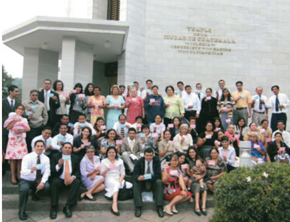
Sfinții din țarașul Ilopango, El Salvador, San Salvador, merg la templul Guatemala din orașul Guatemala.

Dar ce se întâmplă cu aceia dintre dumneavoastră care nu au acces la calculator sau care preferă să nu folosească această tehnologie? Nu vă faceți griji! Înaintează pas cu pas. Începeți acasă. Începeți cu o cutie goală de carton, așa cum a sugerat președintele Boyd K. Packer. 11 Puneți în acea cutie informații importante despre dumneavoastră și familia dumneavoastră. Adăugați informații strânse de la ceilalți membri ai familiei dumneavoastră. După aceea, cereți ajutorul consultantului pe probleme de istorie a familiei din episcopia