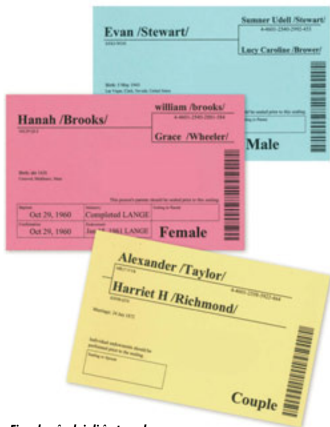
Fișe de rânduieii în templu

nemurirea și viața veșnică – exaltarea – copiilor Săi 2 . „Fiindcă atât de mult a iubit Dumnezeu lumea, că a dat pe singurul Lui Fiu, pentru ca oricine crede în El, să nu piară, ci să aibă viața veșnică” 3 .