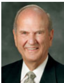
Vârstnicul Russell M. Nelson, din Cvorumul celor Doisprezece Apostoli