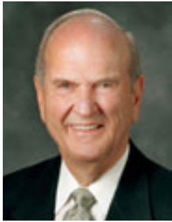
Ouderling Russell M. Nelson van het Quorum der Twaalf Apostelen