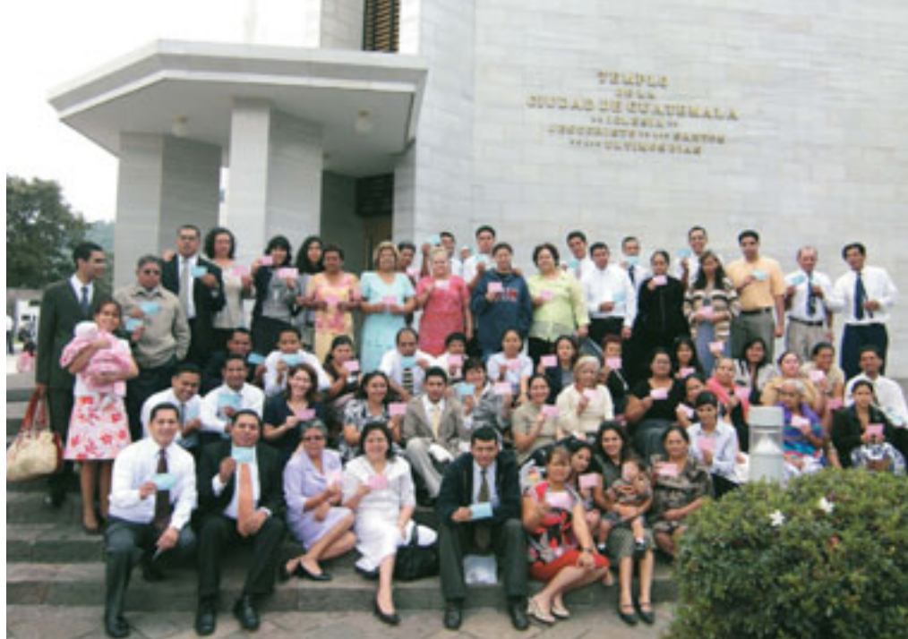
Heiligen uit de ring San Salvador-Ilopango (El Salvador) bezoeken de Guatemala-Stadtempel.

Op basis van dit verzoek tot verordening worden er in de tempel verordeningskaartjes aangemaakt. Als de verordening is verricht, wordt die ingevoerd en diezelfde dag nog in de nieuwe FamilySearch geregistreerd.