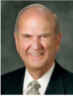
Nataon'ny Loholona Russell M. Nelson

Ao amin'ny Kôlejin'ny Apôstôly Roambinifolo