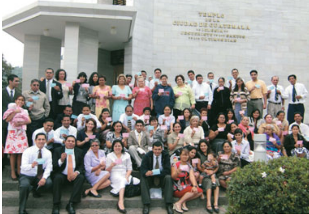
Nandeha tany amin'ny Tempolin'i Guatemala City any Guatemala ireo olomasina avy any amin'i Tsatòkan'i Ilopango San Salvador any El Salvador.

Nampiova ny fomba fiasa amin'ny fanaovana tetiarana ilay rafi-pandaharana FamilySearch vaovao tamin'ny alalan'ny fanamoràna ny famoronana rohim-pirazanana iombonana. Taloha dia olona iray ihany no miasa mitokana, sy mitahiry ny firaketan'ny fianakaviany. Matetika dia tsy mahafantatra ny asa ataon'ny fianakaviana sasany akory ny olona iray. Ankehitriny dia afaka mitondra fampahalalana ny tsirairay rehefa