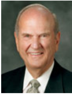
Ni Elder Russell M. Nelson Sa Korum sa Napulog Duha ka mga Apostoles