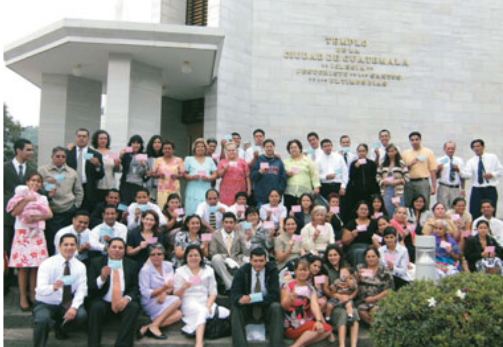
Mga Santos gikan sa San Salvador El Salvador Ilopango Stake mitambong sa Templo sa Guatemala City Guatemala.

Dayon i-print out nimo ang Family Ordinance Request . Kini nga dokumento naghatag og kasayuran nga gikinahanglan sa templo ug dili na kinahanglan nga dad-on nimo ang mga computer disc .