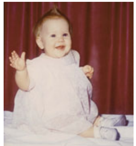
Apohan nga babaye ni “Dear Ruby,” anak nga babaye ni Elder Nelson